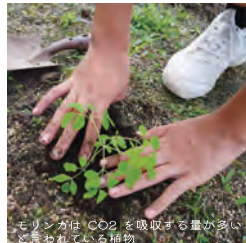
モリンガはCO2を吸収する量が多いと言われている植物

中央小学校6年生10名が種まきから収穫、乾燥と手掛け、徳地健康茶企業組合の協力でお茶に加工し、南大門でSDGs(地球環境の大切さ)を伝えながら販売しました。