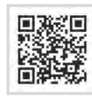
厚労省「まもろうよこころ」サポートするためのさまざまな取り組みの情報サイト