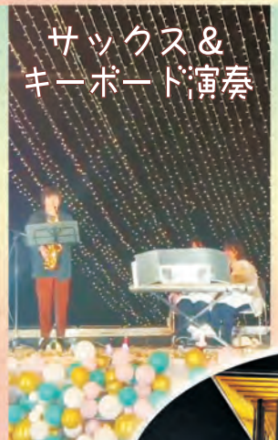
サクソ& キーボード演奏