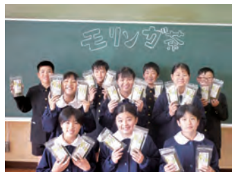
(取材：徳地づくり達人塾)