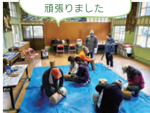
(取材：徳地づくり達人塾)

この程、可愛らしくペイントされ、大原湖キャンプ場に設置されました。皆さんをお迎えていますよ。