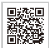
①やまぐち健幸アプリ