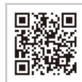
山口市ゴミ情報サイト