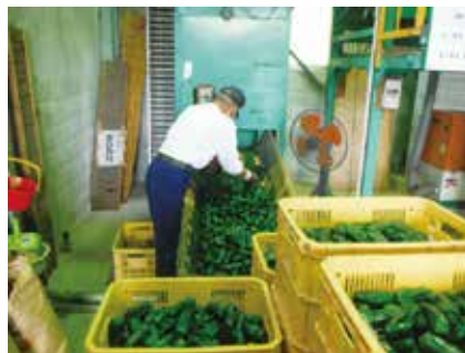
ピーマン選果場(徳地堀)