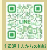
↑重源上人からの挑戦