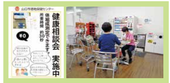
丸久での健康相談会の様子