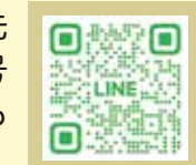
↑重源上人からの挑戦