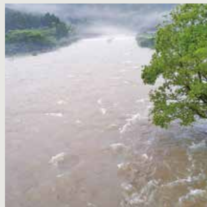
線状降水帯発生 記録的な大雨