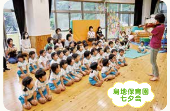
島地保育園 七夕会

7月7日に七夕会をしました。午前中は、七夕についての絵本や職員の劇を楽しみ、午後からは「七夕ミニコンサート」と題してプロのバイオリニスト(アメリカの世界的オーケストラ常席)をお招きして本物の音に触れ、その音色に合わせて季節の歌を歌ったり楽しく優雅な時間を過ごしました。