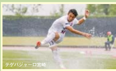
テゲバジャーロ宮崎