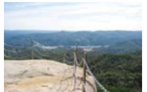
山頂の大岩から望む絶景

10年前に帰郷した頃だったか、徳地町時代の昭和33年11月に名勝指定された白石山に自家製弁当片手に10回ほども登ったことがあります。引谷夏焼の登り口から私の足でも楽に40分ほどの山頂の大岩から望む風景は、防府市の大平山から右田ヶ岳に留まらず、遠く大分の方まで見え・・・。