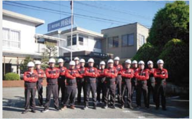
本社社屋前に勢揃い