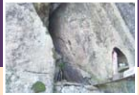
接待岩の奥の岩穴に鎮座する白石観音