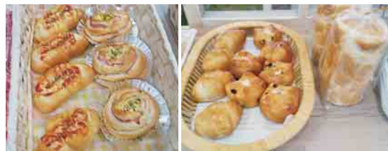
様々な調理パンに人気の丸型食パン