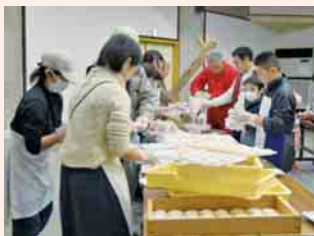
地域もつつき大会の一場面

集落支援員として徳地にお世話になり始めて3年目を迎えています。沢山の方々から暖かいお言葉や時には難しい課題を受けながら、その一つ一つを栄養にして成長できる喜びを噛みしめてきました。2年間続いたこの「集落支援員だより」も今月号で終わります。「いつも楽しく読ませてもらっています」「いろいろなことをされているんですね」と声をかけていただくことが大きな励みになりました。長い間のご愛読誠にありがとうございました。 振り返って「集落支援員とは何をすればよいのか」をいつも考え続けてきました。最初のころは、地域の皆様に顔を知ってもらおうと、各地で行われるイベントには努めて参加してカメラを片手に写真を撮りまくっていました。「あの人見かけん人じゃけど誰かいね」が、いつの間にか「また来てね」と会う方々の言葉も変わっていきました。「地域の皆様との話し合いを通して地域課題を探り、地域の方々と一緒にその解決策を考える」。言葉では簡単に言えますが「ではどうするか」。地域課題に終わりはありません。これからもこの難題に皆様と一緒に一つ一つ試行錯誤しながら取り組んでいきたいと思っています。引き続きご支援ご協力のほどよろしくお願い申し上げます。