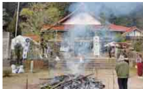
島地、出雲大社周防分院（3日）