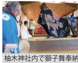
柚木神社内で獅子舞奉納

柚木神社の境内に、小さな祠の秋葉神社があります。旧正月十一日(今年は2月4日)に秋葉神社で祝詞を挙げた後、柚木神社の中で獅子舞が踊られました。今も、地区の人々の手で継承されています。