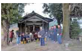
伊賀地、大元神社（3日）