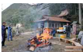
伊賀地、山根八幡宮（3日）