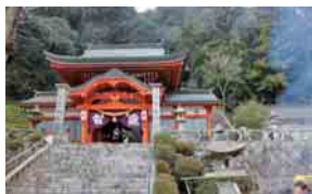
島地、花尾八幡宮（3日）