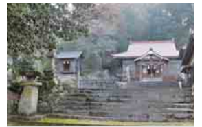
左の祠が秋葉神社、右が柚木神社

村人は白狐の祟りと恐れて火除けの神様に願をかけ、火を消してくれたらお礼に、獅子舞を舞いますからと熱心にお祈りしました。すると、あれほど燃え続けていた火がぱったりと消えたのです。それから村人は毎年獅子舞を奉納し悪払いを祈り続けています(「徳地の昔ばなし」から抜粋)。