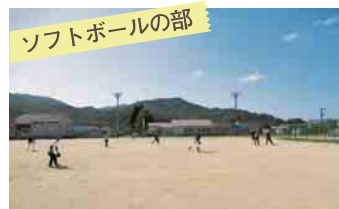
ソフトボールの部