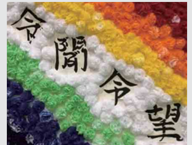
ヒント：令(さば)聞(ぶんこうぶ)令(んか)望(さい二十九九)