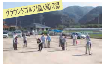
グラウンドゴルフ(個人戦)の部