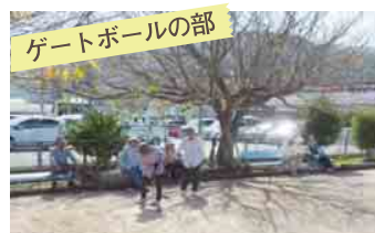
ゲートボールの部