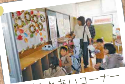
地域ふれあいコーナー