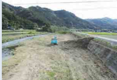
廣瀬橋から見た工事風景

「ふるさととくぢ」のこの欄で以前「佐波川美化ボランティア活動」について書きました。元々地元の方が整地されていたところに草木が育ったのでボランティアの方々がいかにきれいになった内容でした。今、そのすぐ上流や下流を、山口県防府土木建築事務所（以下県土木）が発注者となって河川改修工事が行われています。正式には「佐波川総合流域防災（緊急対策）工事」で、上八坂く才契く小古祖にかけての川岸を来年2月28日までの予定で進められています。 このあたりは大きな木があちこちにあって大水が出るとゴミが引っ掛かり災害につながりかねないところ。県土木の担当者の方が「広報誌『ふるさととくぢ』で地元の方が自主的な活動として河川をきれいにされている記事を読みました」と言われていました。地元とボランティアの方々の活動がこの工事に影響を及ぼしたかどうかはわかりませんが、これらの活動が「地域の方々の安全」にささやかでもつながっていればこれ以上嬉しいことはありません。