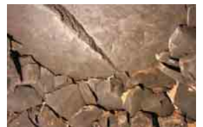
石風呂の中はむき出しの石(天井)