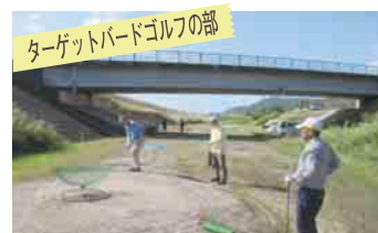
ターゲットボードゴルフの部