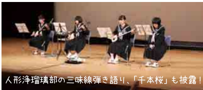
人形浄瑠璃部の三味線弾き語り、「千本桜」も披露!