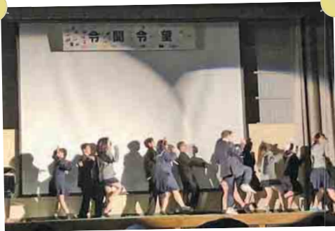
学年対抗出し物コンテスト