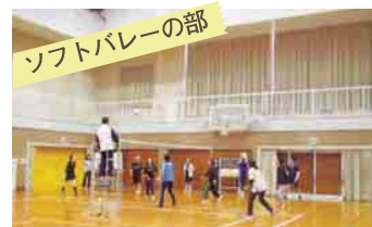
ソフトバレーの部