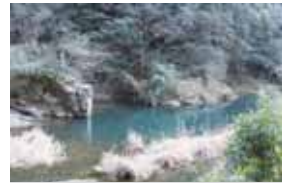
僧取淵は、蓮華坊遭難の地

文治二年(1186)、奈良東大寺の再建事業の勅命を受けた俊乗房重源上人が、徳地の杣山に入り、その用材を伐り出す一大事業を率いたのは有名です。その弟子蓮華坊が木材の搬出作業中に佐波川ダムの近く「僧取淵」で落命しました。文治五年八月二日のことと伝えられています。