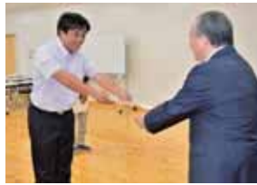
委嘱状交付式の様子

地域への定住促進や地域の活性化につなげようと、地域の生活や仕事、空き家に関する情報を定住希望者へ提供しています。任期は令和元年9月12日から2年間で、徳地地域では現在18名の方が定住サポーターとして、定住希望者を支援しています。