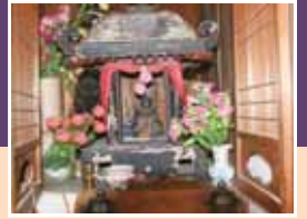
お興に納められた蓮華坊の木像