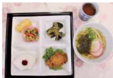
うどんと定食のセット (数量限定)

レノファ山口の練習場で知られる、「やまぐちサッカー交流広場」の観客席下に開設されており、地域内外の交流と活力の場となっています。