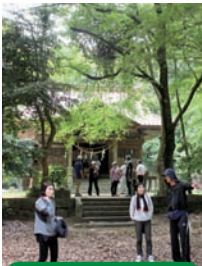
須賀神社で休憩中

5月26日(日)は、小古祖ふれあいの館にいつものメンバープラス小古祖の人たちも9時に集まって、ラジオ体操で体をほぐしてから、小古祖山里めぐりマップを片手に出発。ワイガヤの会が草刈りを済ませた才契の河川敷で、一服。須賀神社境内のパワーを感じて、9月の参道の彼岸花を想像しながら帰路につきました。