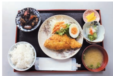
日替定食 (この日は白身魚のフライ)

定休日 土・日曜日・祝日 営業時間 11時～14時半 ☎0835-52-0884