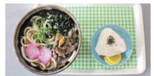
うどんとおむすび

口コミ情報、居心地の良さ、4つ星の山村開発センター内、食堂の「味工房 食彩」を紹介します。親子丼やうどん各種、また火曜日は、豚カツの日、等々メニューも豊富ですが、中でも一番人気は、日替定食です。常連客も多く、おばちゃんの気さくなおもてなしが、