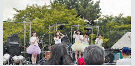
花火大会サブステージも盛り上がりました！

天候不順に悩まされた日本列島。徳地のまちは、地区の夏祭りもフィナーレを彩る花火大会（観客：約1万人～実行委員会発表）も無事開催されました。