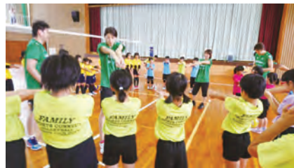
アンダーハンドの正しいフォームを習いました。