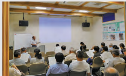
幕末維新の歴史を語るガイド養成講座

重源上人の頃に伝わった手漉き和紙が、徳地へ人形浄瑠璃をもたらしました。幕末の奇兵隊・膺徴隊に入隊した少年が長じて文楽を学び、徳地で人形浄瑠璃を広め、今また、人形浄瑠璃を演じる中学生たち。岸見石風呂や法光寺で開山忌、上人忌が開催され、幕末維新の歴史を語るガイド養成講座に参加する人々。徳地は歴史と文化の魅力がいっぱいです。