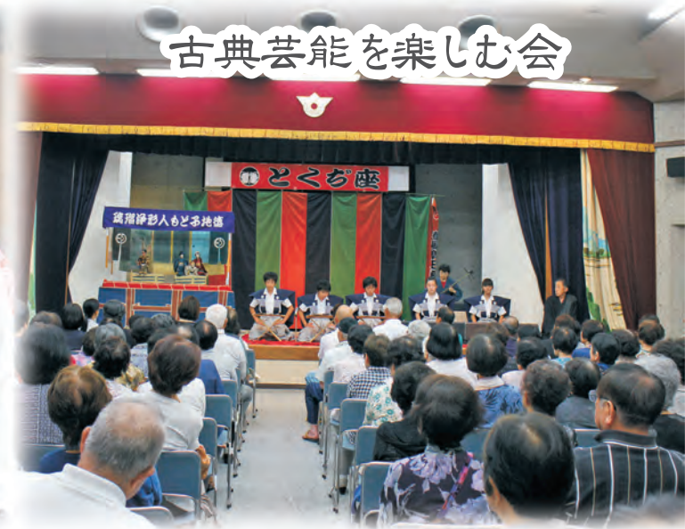
古典芸能を楽しむ会