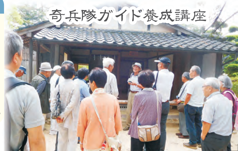
奇兵隊ガイド養成講座