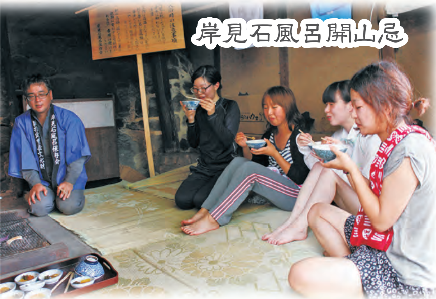
岸見石風呂開山忌