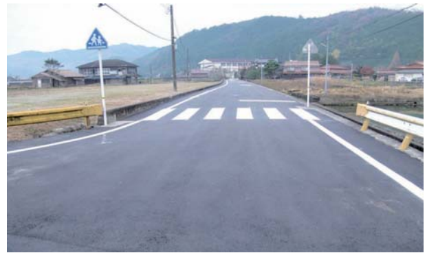
平成 25 年度事業 市道大久保大町線 (山口市徳地島地)

山口市徳地総合支所施設維持課では、この補助金を活用し、災害発生時の避難路、通学路となる市道の舗装補修工事を実施しています。