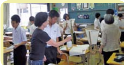
地域の人々のサポートを受けて製作中