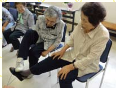
7月11日 引谷・船路地区 『足でホイホイ』