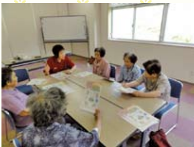
7月12日 野谷・河内地区 『熱中症に気をつけて!』

山口市一次予防通所型介護予防事業 問合せ・申込み: 基幹型地域包括支援センター 徳地分室 ☎52-0670