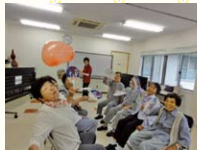
7月1日 小古祖・深谷地区 『パタパタ「ふうせん」』