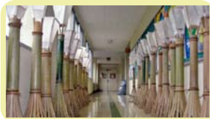
廊下にずらりと並んだ徳地和紙竹灯篭