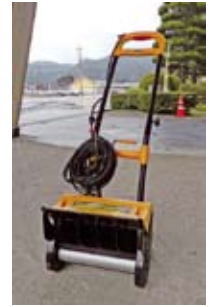
電動式除雪機 (出雲・八坂・島地)