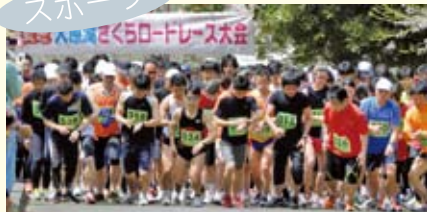
大原湖さくらロードレース