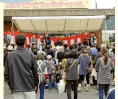
徳地フェスティバル

このことから、少なくとも奈良時代初期までその創建の時期はさかのぼりうるのである。 そして、『延喜式神名帳(九二七)』に、出雲神社と並んで御坂神社があげられ、位階も『続日本後記』の承和六年(八三九)に無位から従五位下に叙せられたのを最初として、『三代実録』の貞観九年(八六七)に従三位、『長寛勘文』の天慶三年(九四〇)に正三位と昇階し、平安時代の終わりに正一位に至る。 これらの位階は、天慶の場合、承平五年(九三五)に海賊鎮撫を祈念したことが理由であるよ