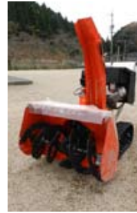
動力式除雪機 (柚野・串)

徳地地域づくり協議会では、除雪サービス事業に使用する動力式除雪機を柚野、串地区に、その他の地区には電動式除雪機を配備しました。