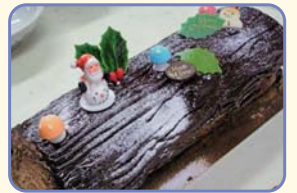
※昨年はブッシュ・ド・ノエルを作りました。

申込先 徳地地域交流センター ☎52-0217 11月19日(月)~12月7日(金)【土・日・祝日を除く】