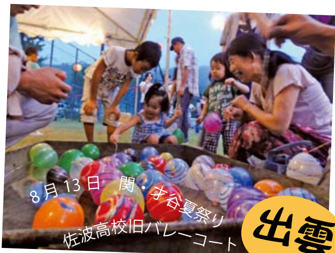
8月13日 関・宇谷夏祭り 佐波高校旧バレーコート