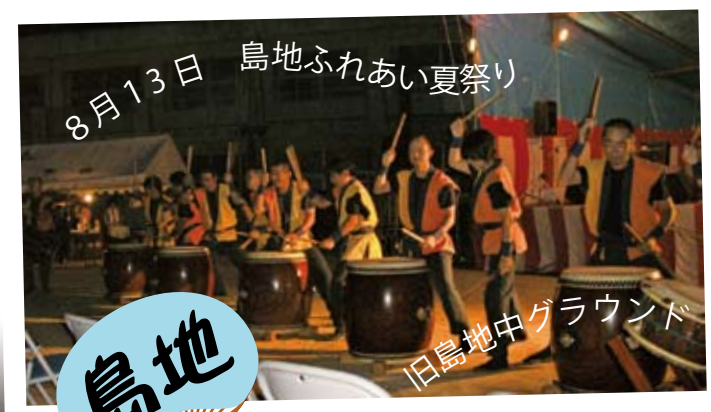
8月13日 島地ふれあい夏祭り