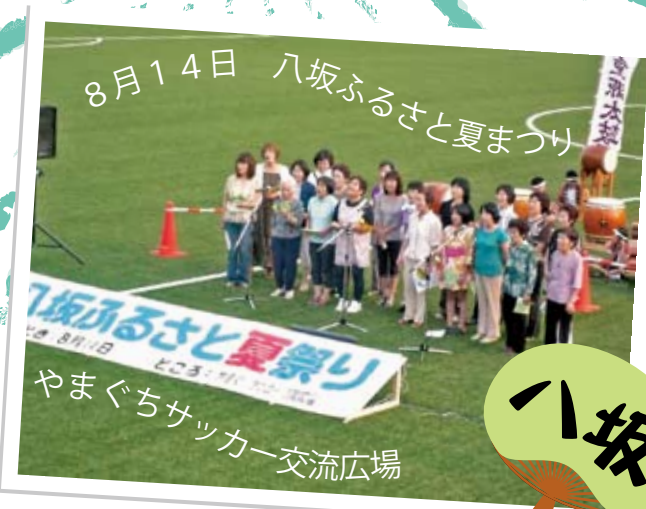
8月14日 八坂ふるさと夏まつり