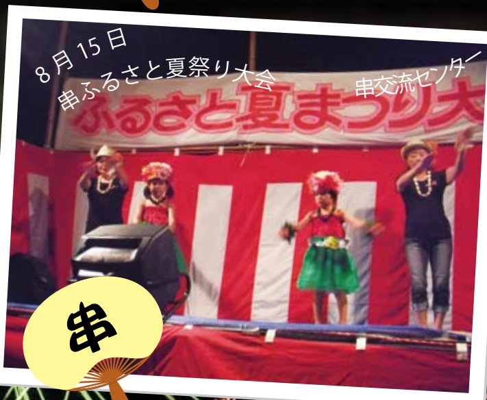
8月15日 串ふるさと夏祭り大会