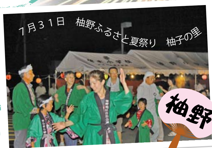
7月31日 柚野ふるさと夏祭り 柚子の里