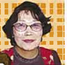
監修 戸田幸子さん