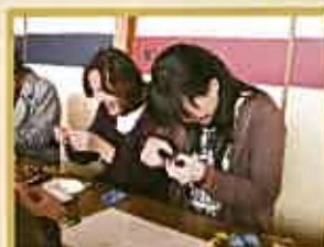
交通安全の和紙人形を作っているところです