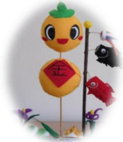
串のイメージキャラクター くっしー

集合場所 徳地地域交流センター串分館 受付時間 9:40~10:00 参加料 大人500円・3歳以上小学生以下300円 当日徴収いたします 昼食代・保険料含みます