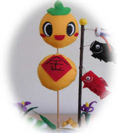
串のイメージキャラクター くっしー

集合場所 徳地地域交流センター串分館 受付時間 9:40~10:00 参加料 大人500円・3歳以上小学生以下300円 当日徴収いたします 昼食代・保険料含みます